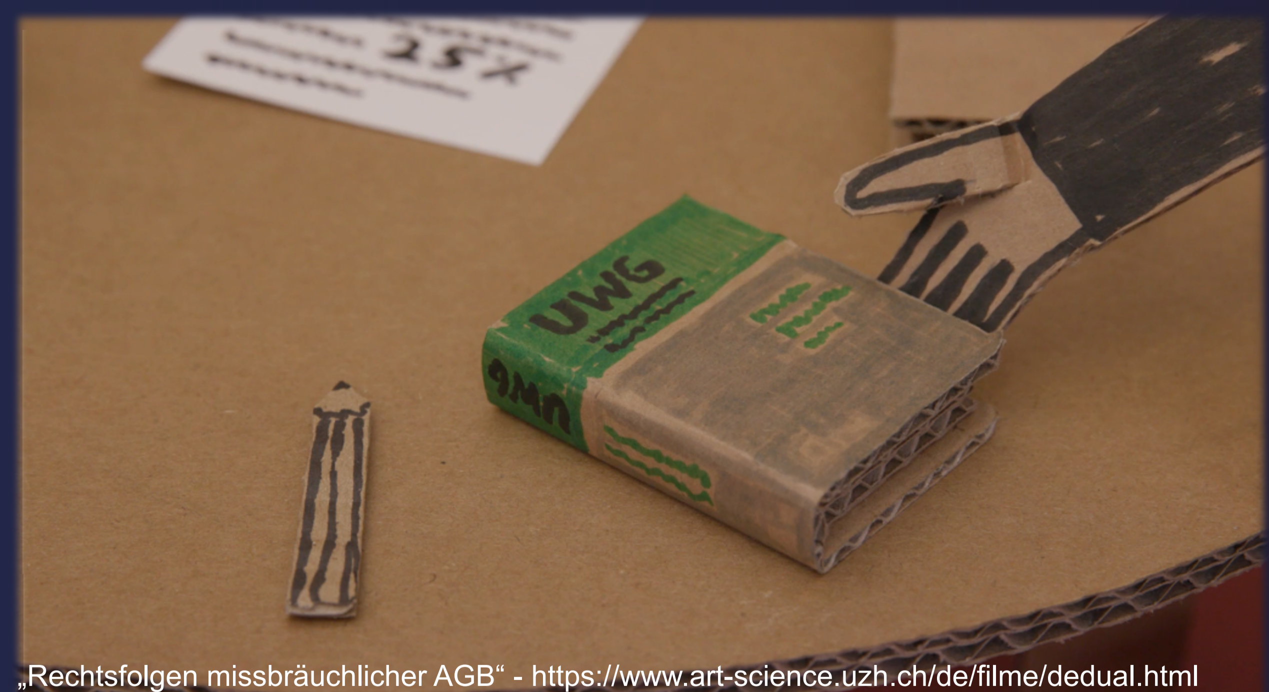
„Rechtsfolgen missbräuchlicher AGB“ - https://www.art-science.uzh.ch/de/filme/dedual.html