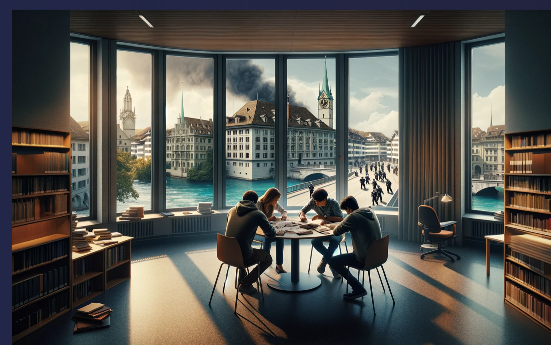
«Studierende arbeiten mit Fallvignetten»