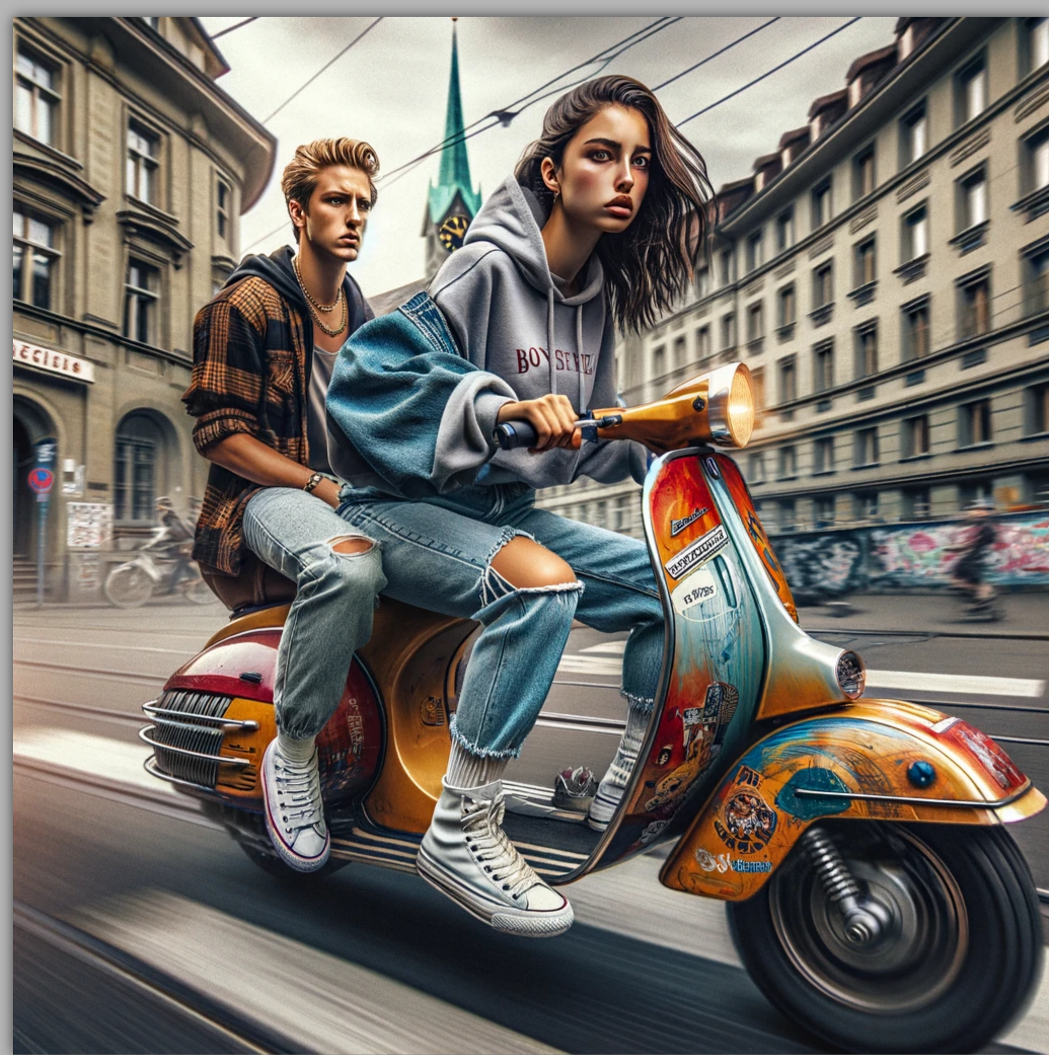
«Anais und ihr Freund fliehen auf dem Roller»